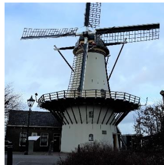
De Haas krijgt goot op stelling

Vorige week is in nauwe samenwerking met het Molenfonds van de Vereniging De Hollandsche Molen een crowdfundingactie gestart voor een gootsysteem