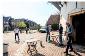
Buiten uitleveren van bestellingen in tweede kwartaal 2020

Aan het Jaarverslag 2020 wordt dezer dagen de laatste hand gelegd. Daarna kan het naar de drukker en in mei ontvangen de Vrienden van Korenmolen De Haas (lees: onze vaste jaarlijkse donateurs) een exemplaar.